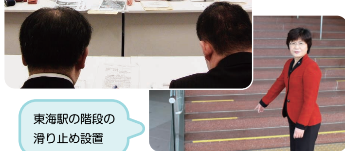
東海駅の階段の 滑り止め設置