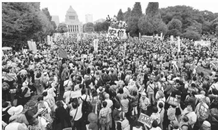
12万人が参加した「戦争法案反対・安倍内閣退陣 8.30国会前大行動」